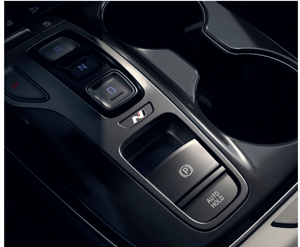
Logo N je umístěno i na elegantním krytu středové konzoly s elektronickým ovládáním převodovky tlačítky „Shift by Wire“.