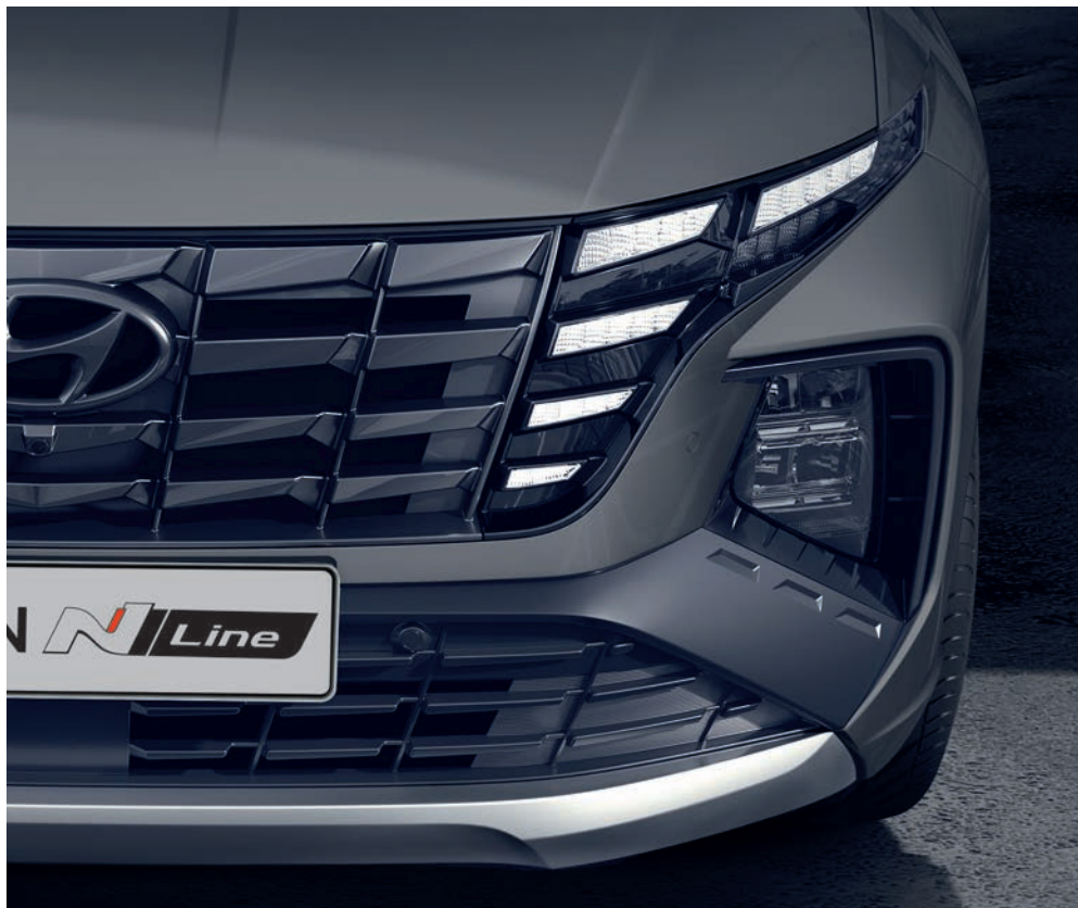
Širší hranatý nárazník N Line se zvětšenými otvory pro vstup vzduchu je nápadným prvkem přední části karosérie.

Konstruktéři zvýraznili stabilní široký postoj modelu Tucson N Line posunutím masky chladiče a nárazníků více do boků, což zdůrazňuje horizontálně orientovaný, atletický vzhled vozu. Širší lichoběžníková maska chladiče nese logo N Line a přední světlomety jsou černě lemovány, aby ještě více vynikla jedinečnost designu N Line.