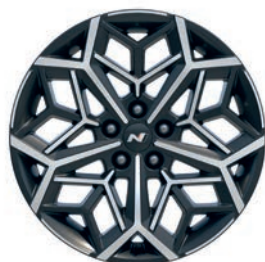
19" kola z lehké slitiny

Tucson N Line je vybavený výraznými 19" disky kol z lehké slitiny s jedinečným designem, které působí velmi energicky a sportovně.