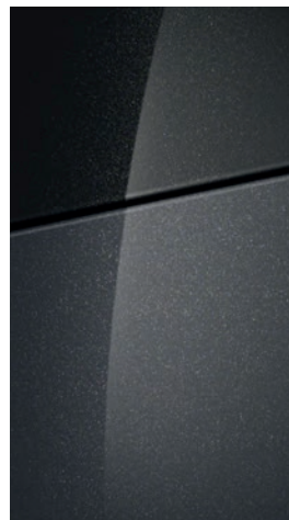
Dark Knight Gray Pearl

Na přání střecha v barvě Phantom Black Pearl.