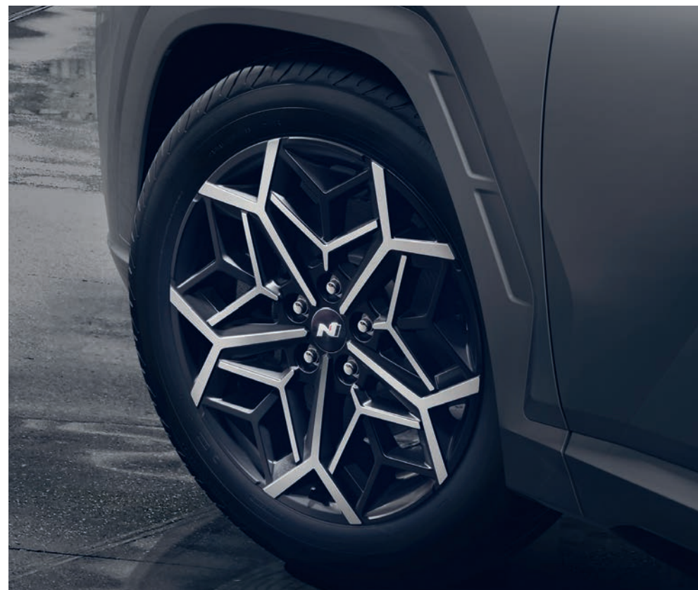
Výrazné 19" disky kol z lehké slitiny umocňují sportovní vzhled modelu Tucson N Line.