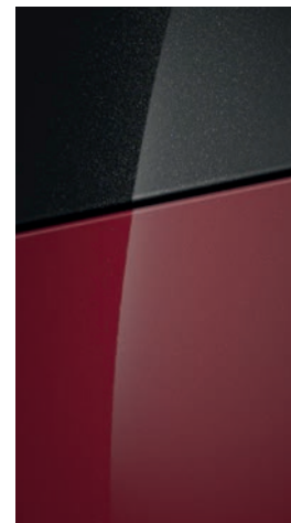
Sunset Red Pearl

Na přání střecha v barvě Phantom Black Pearl.