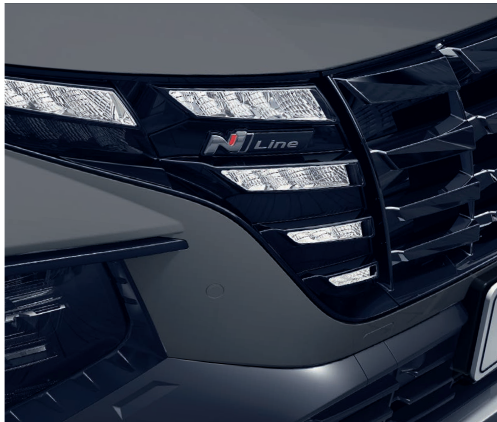
Logo N Line na jedinečné masce chladiče podtrhuje sportovní vzhled vozu.