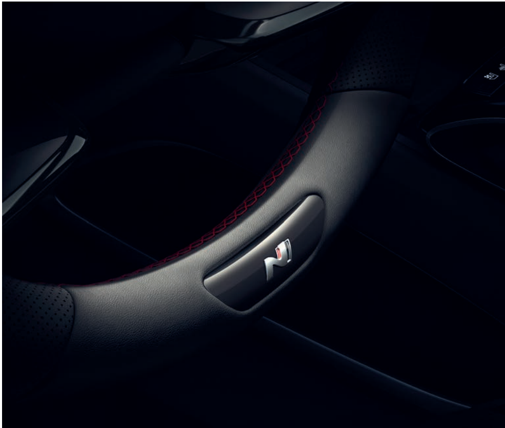
Sportovní volant s metalickými rameny je potažený jemnou kůží s červeným kontrastním prošíváním a doplněný logem N.

Vítejte na úplně nové úrovni preciznosti. Posadte se do přepracovaného interiéru modelu Tucson N Line a ihned pociťte jeho příjemnou atmosféru elegance a profesionality. Sportovní sedadla s logem N jsou potažena luxusní kombinací perforovaného semiše a kůže a vkusně doplněna červeným kontrastním prošíváním, které se opakuje i na obložení dveří a opěrce rukou. Další designové prvky N se vyskytují i na kožené hlavici řadicí páky, případně konzole s elektronickým ovládáním převodovky tlačítky „Shift by Wire“. Dalšími jedinečnými prvky interiéru Tucsonu N Line jsou černé čalounění stropu, kovové pedály, opěrka levé nohy a dekorační lišty prahů dveří.