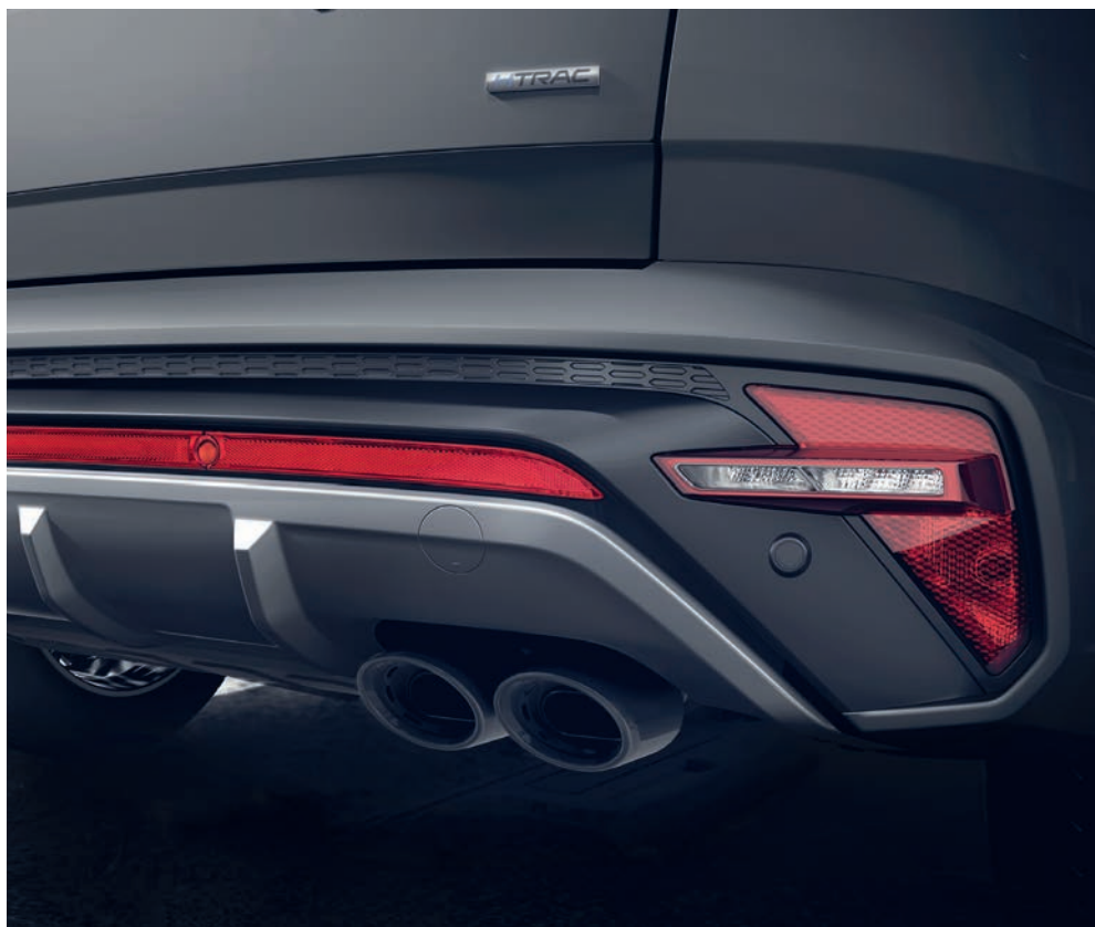
Zadní nárazník se sportovní dvojitou koncovkou výfuku je harmonicky doplněn stříbrným difuzorem, který je akcentovaný červeným reflexním pásem.